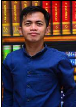
Basrie, S.Kom., M.Kom Ka. Pusat Komputer (PUSKOM)